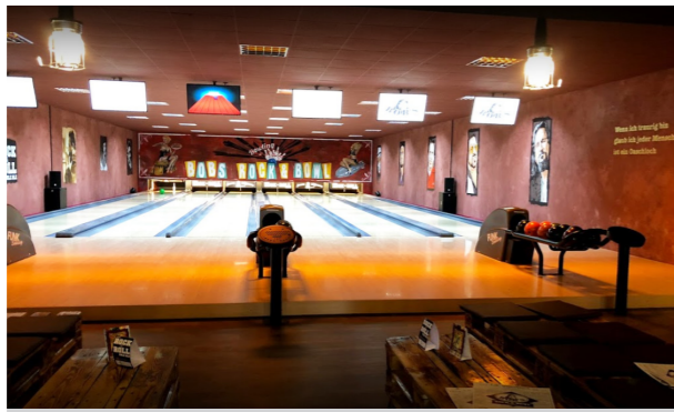
In Fürth zauberte Bob's Rock and Bowl aus einem ehemaligen Discounter dieses Bowlingcenter im gewohnten Rocker-Stil.

In Ingolstadt Unsern herrn entsteht nun ein Center mit 6 Bahnen, Billard, Kicker und Dart. Auf dem Parkplatz ist zudem ein Biergarten mit 200 Plätzen ange-dacht. Das Center ent- steht in einem 20 Jahre alten Edeka-Markt.